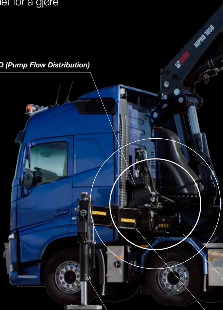
Enkel tilting av støttebeina