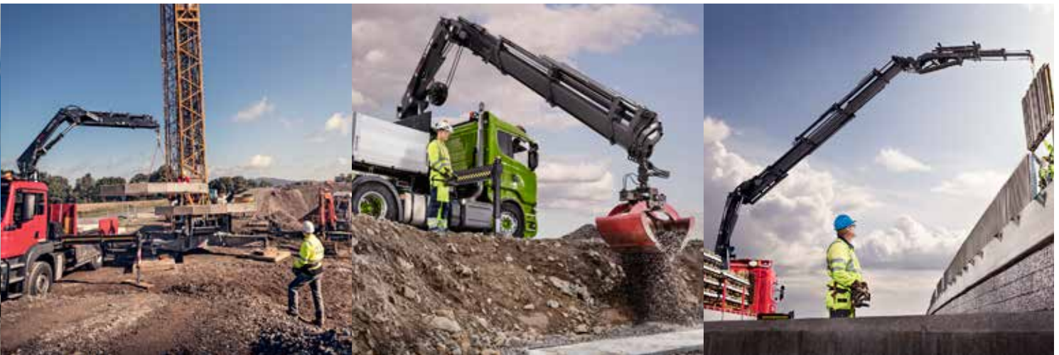
HIAB X-HiPro 232

HIAB X-HiPro 192-, 262- ja 302 -kuormaustoreihin on saatavana myös jib. X-HiPro 142, 162 ja 232 on optimoitu kapasiteetiltaan käytettäväksi ilman jibiä.