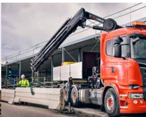
HIAB X-HIDUO 298