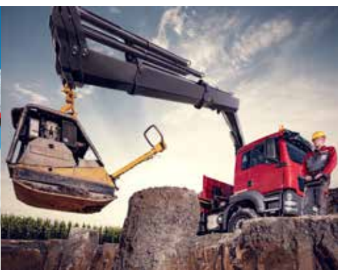
HIAB X-HIDUO 228

Vissa av HIAB:s medelstora kranmodeller finns också med ett EP-armsystem, där E-länk-konstruktionen har optimerats för färre men längre utskjut. Den unika konstruktionen ger ännu mer kraft för lyft nära lastbilen.