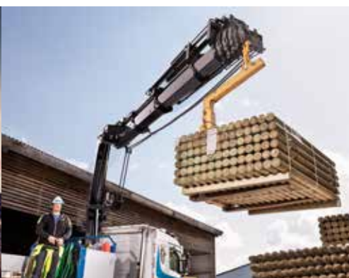
HIAB X-HIDUO 258